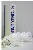
Bälle mit Korkfuß