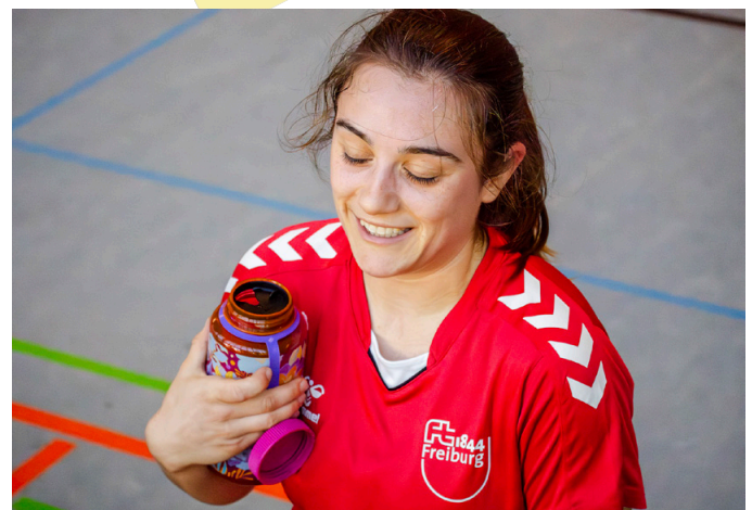
Impressionen vom Turnier in Seelbach