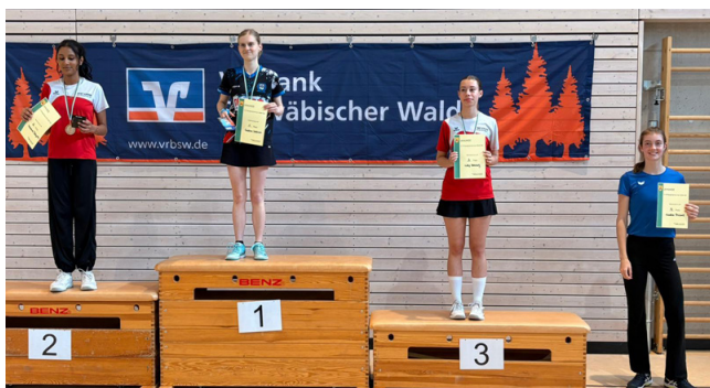
Von oben nach unten: Jungeneinzel U15, U17, Mädcheneinzel U13, U19

Erneut präsentierten sich die Turn- und Sportfreunde Gschwend als Ausrichter eines Jugendturniers, dieses Mal jedoch der D-Rangliste. 70 Teilnehmende nahmen dieses Angebot wahr und trafen sich im Erholungsort zum sportlichen Kräftenessen.