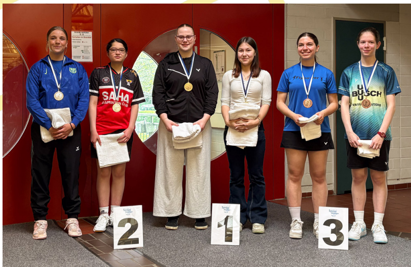
Podium Mädchendoppel U19