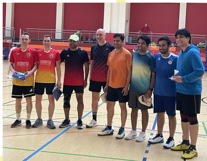
Siegerehrung Doppel B