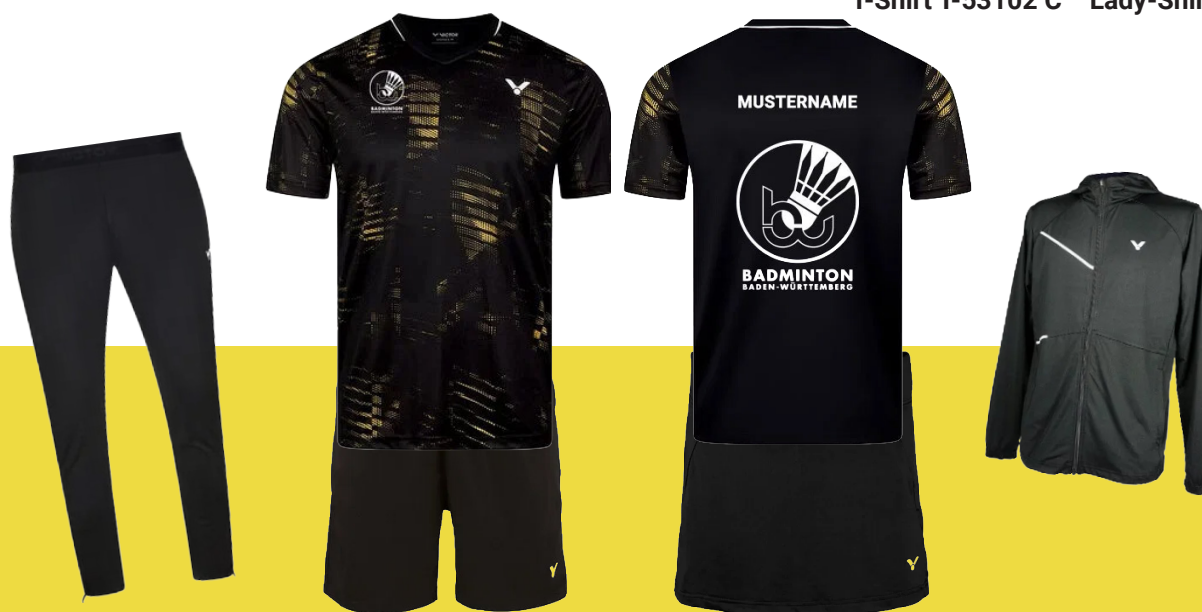
VICTOR T Lady-Shirt T-54102 C