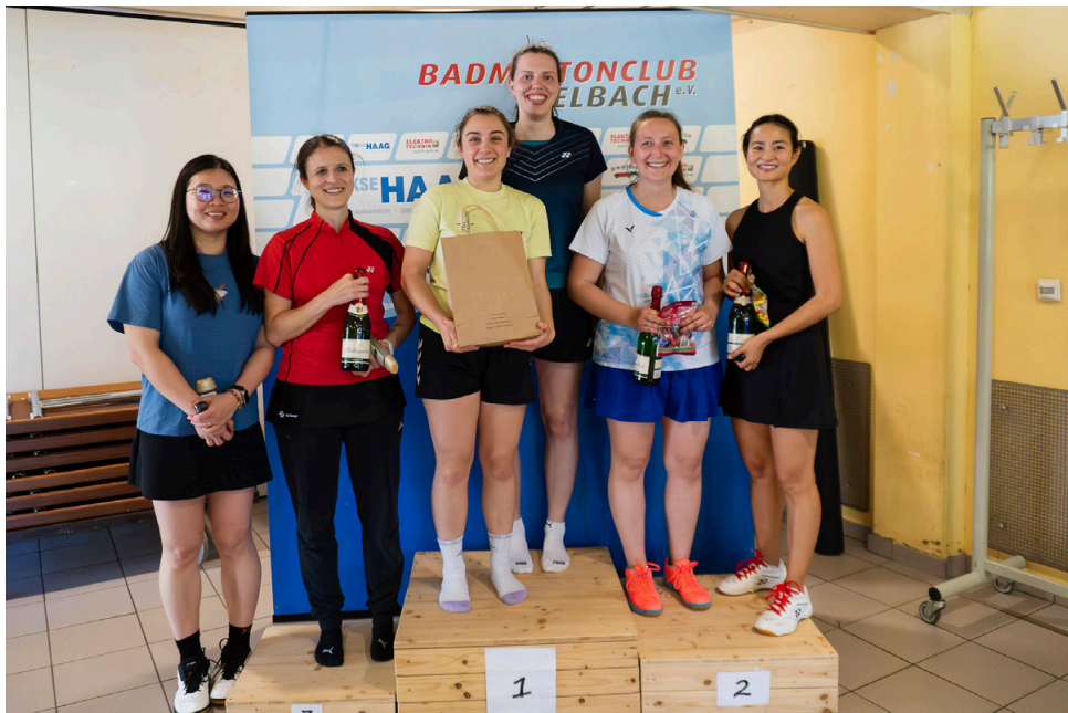
Das Podium im Damendoppel