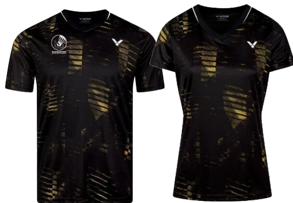
VICTOR T-Shirt T-53102 C

Set 122,50 € (inkl. MwSt, zzgl. Versand)