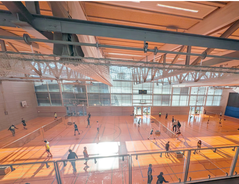
Blick in die Wehle-Halle