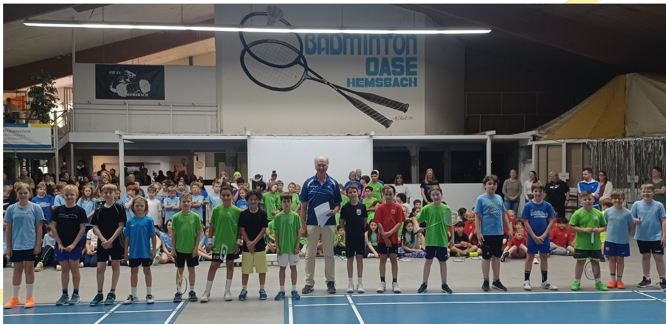
Den ersten vier der vier Gruppen wurde extra gratuliert