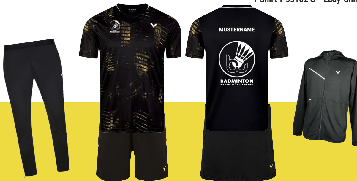
VICTOR T Lady-Shirt T-54102 C