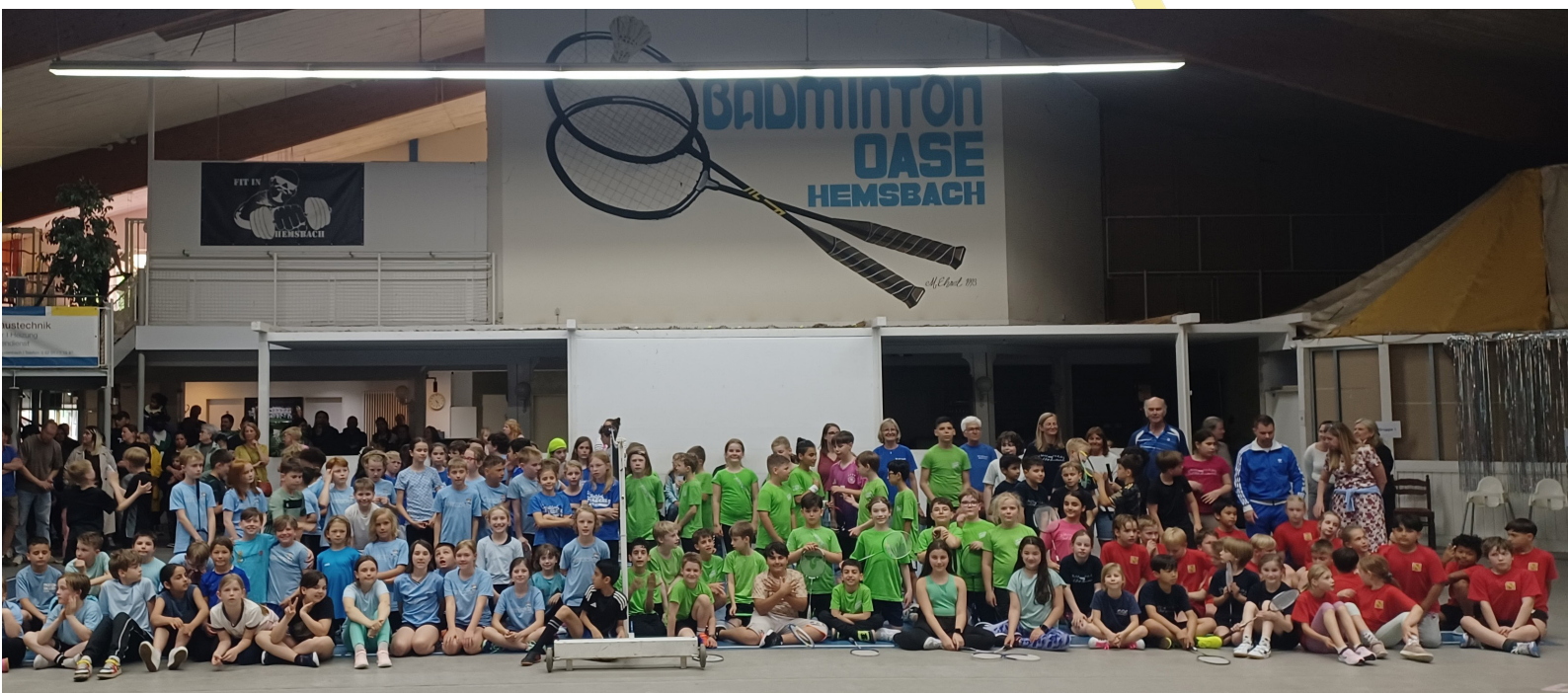
Über 120 badmintonbegeisterte Grundschul Kinder beim Turnier

Bei der Siegerehrung erhielten die Mannschaften JtFO-Urkunden. Karlheinz Hohenadel dankte den betreuenden Lehrkräften, die für die Vorbereitung und Durchführung des Turniers Freizeit geopfert haben. Er lobte die Schüler für ihre Fairness und ihren sportlichen Einsatz.