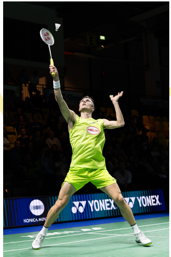
Superstar Viktor Axelsen bei den YONEX German Open 2026