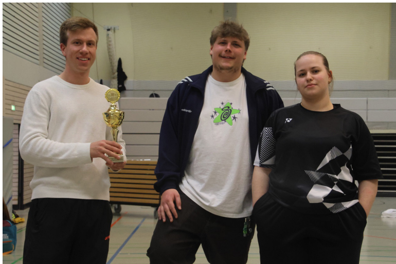
Teilnehmer der TSG Weinheim