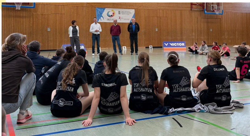
Siegerehrung am ersten Tag

Bei der U20 frei ging der Titel an das Evangelische Firstwald Gymnasium Mössingen. Die Mannschaft behauptete sich in einem engen Teilnehmerfeld knapp vor dem Alexander-von-