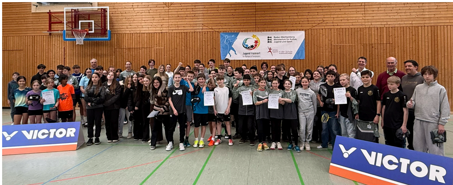
Gruppenbild vom ersten Tag des Landesfinales Jugend trainiert für Olympia in Altshausen