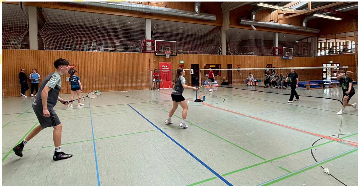
Über 300 Spiele wurden ausgetragen, hier ein Blick auf den Center Court am zweiten Tag

Mannschaft gewann alle Begegnungen deutlich. Den zweiten Platz belegte das Gymnasium St. Konrad Ravensburg, gefolgt vom Otto-Hahn-Gymnasium Ostfildern und dem Theodor-Heuss-Gymnasium Mühlacker.