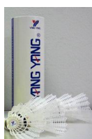
Bälle mit Korkfuß