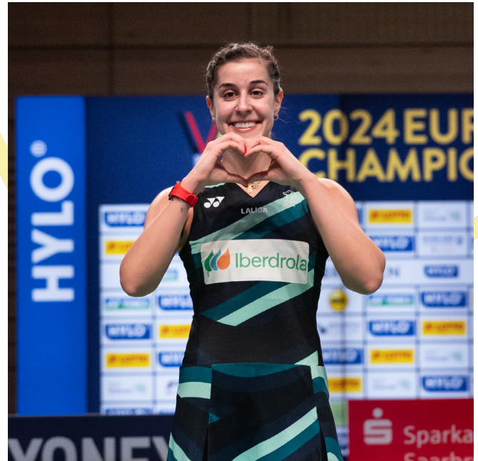
Carolina Marin bei der EM 2024