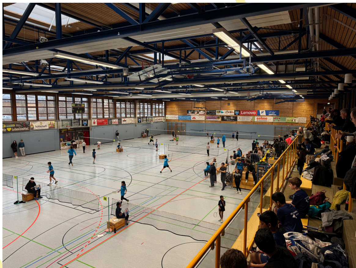
Tolle Stimmung auf den Tribünen in Gärtringen