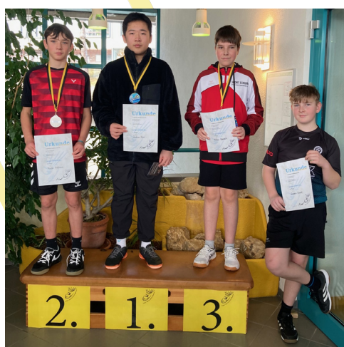
Von oben nach unten: U11, U13, U15 Jungeneinzel