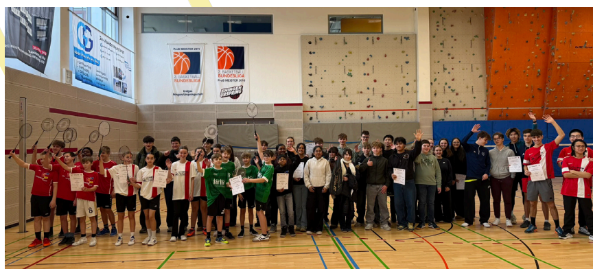
Fotos von oben nach unten: Begrüßung Tag drei, Siegerehrungen Tage zwei und eins