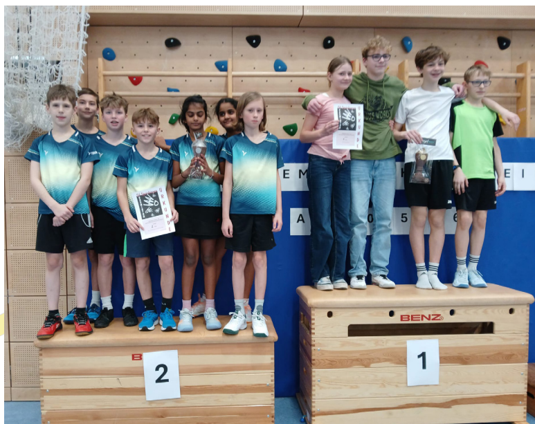
Die zwei besten Schülerteams in Südbaden