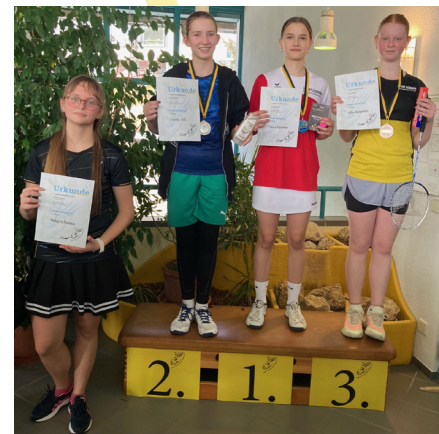
Im Uhrzeigersinn: U17, U19 Jungeneinzel, U11, U13, U15 Mädcheneinzel