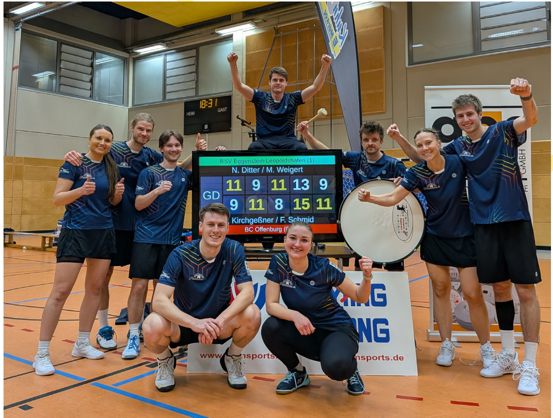
Das Offenburger Team feiert den 3-Punkte-Sieg im Derbystadt

Text: Lena Reder, BC Offenburg