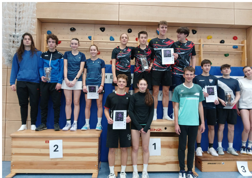
Das Podium bei den Jugendlichen