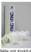
Bälle mit Korkfuß