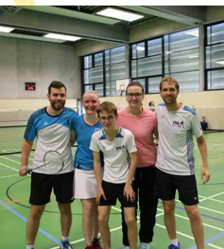
the Muffin men

Natürlich war auch der PSV mit drei Mannschaften vertreten - mit zwei Teams in A und einer Mannschaft in B. Sowohl „the Muffin men“ als auch „Können Nichts, spielen trotzdem“ konnten sehr gut in A mithalten und konnten dann auch den Heimsieg holen. Hier