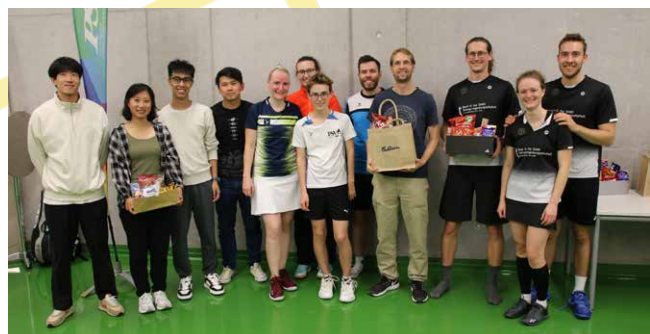
Sieger der A-Klasse: v.l.n.r.: 3. Jumping Smash, 1. the Muffin men, 2. Nimm 3

Wir bedanken uns bei allen Anwesenden für das schöne Turnier und freuen uns wie auch alle Teilnehmenden auf ein Wiedersehen im kommenden Jahr!