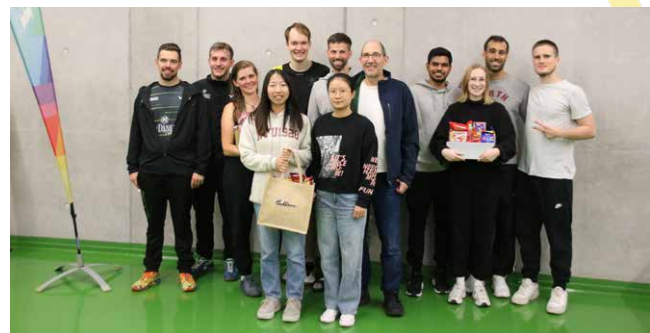
Sieger der B-Klasse: v.l.n.r.: 3. Die Federball-Fetischisten, 1. Auf Feld Drei, 2. Power Smasher