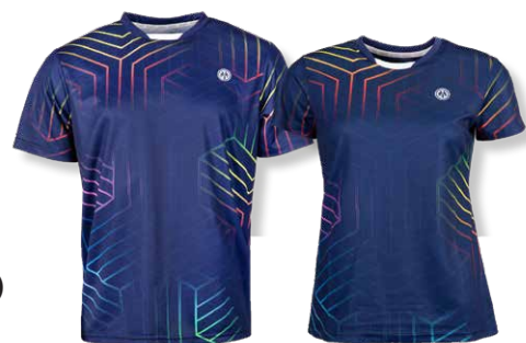
DENVER T-Shirt Art. 8220