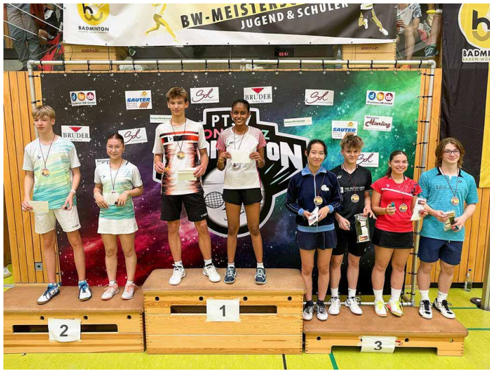
Siegerehrung Mixed U17