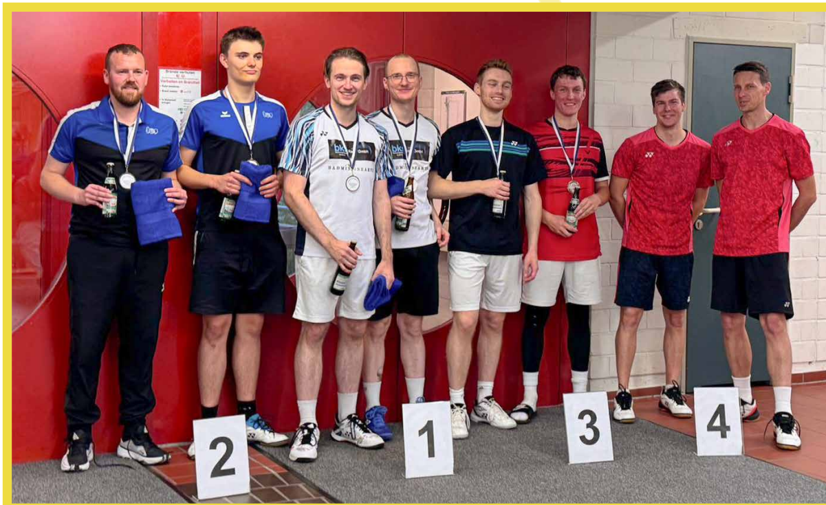
Die vier Erstplatzierten im Herrendoppel A