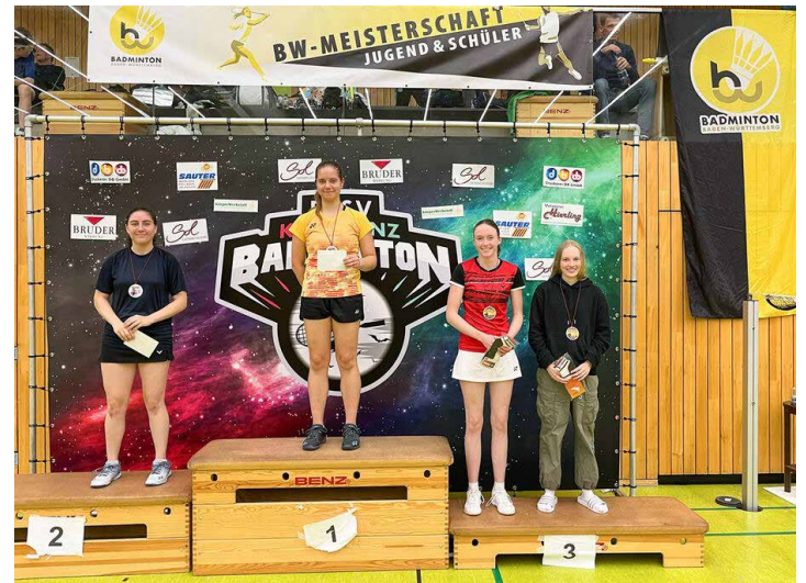
Siegerehrung Mädcheneinzel U19 | Foto: Jörg Reihle

Ergebnisse und Turnierbäume bei turnier.de