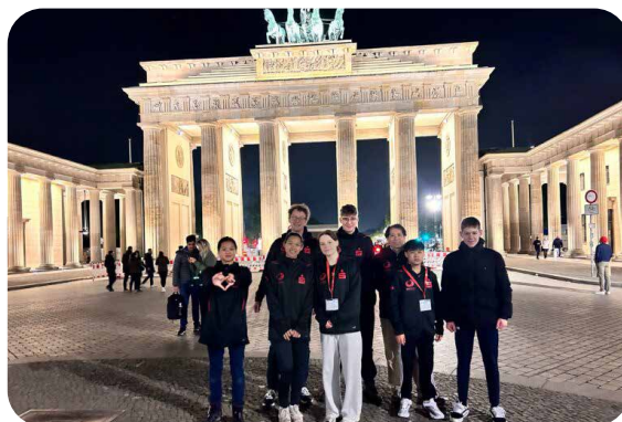
Das Team aus Nagold

Das PG Altshausen kann stolz auf diese Mannschaft sein, die es so weit geschafft hat! Herzlichen Glückwunsch!