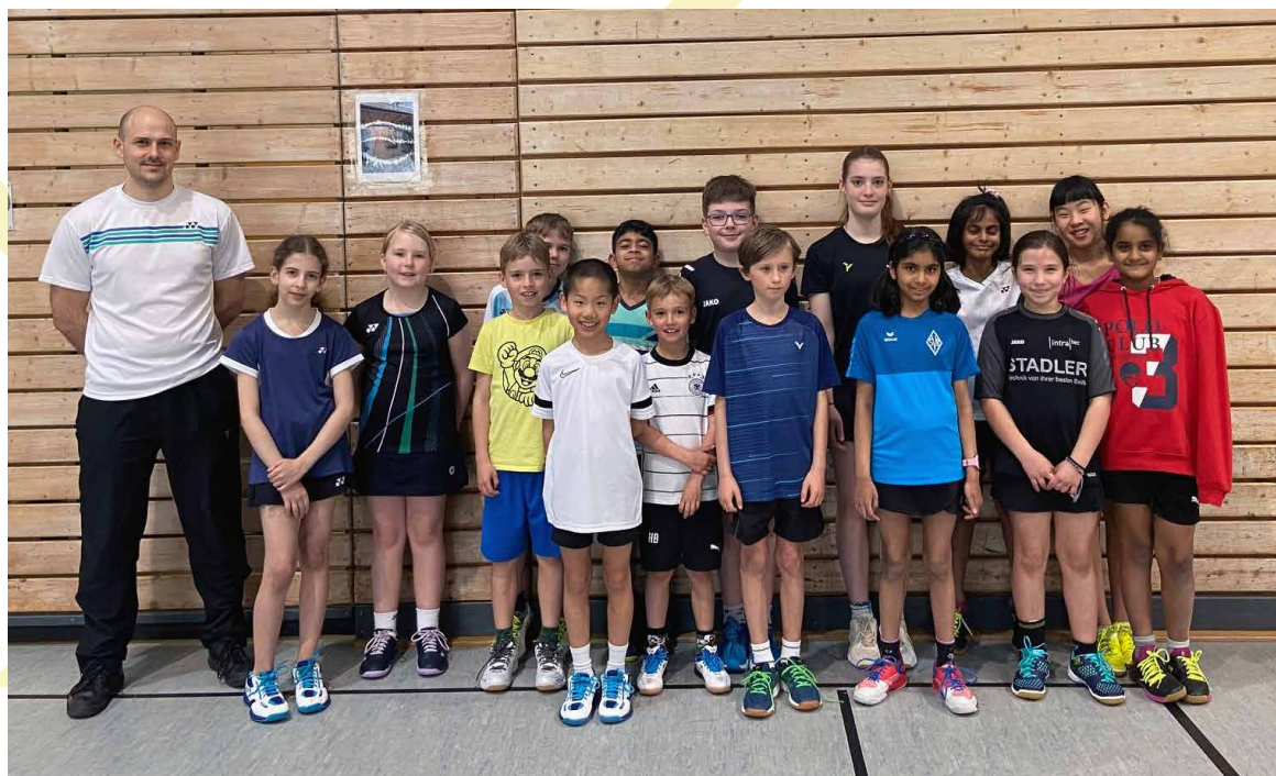
Die Teilnehmer beim Tageslehrgang in Stockach

Ein großes technisches Defizit ist noch im Bereich Schiebebälle festzustellen, sodass die Kinder keine geradlinige Bewegung hinbekommen und zu viel Unterarmdrehung machen. Auch bei einfachen Drives ist die Schlagbewegung zu groß. Ebenfalls sollte ein Auge auf den schnellen Griffwechsel im Vorderfeld gelegt werden.