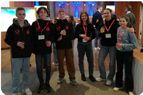
Das Team aus Altshausen

Dass in der Hauptstadt alles eine Nummer größer ist, blieb den Badminton-Cracks nicht lange verborgen. Gespielt wurde in der legendären Max-Schmeling Halle auf Parkettboden und auch die Gegner in den Vorrundengruppen hatten es in sich.