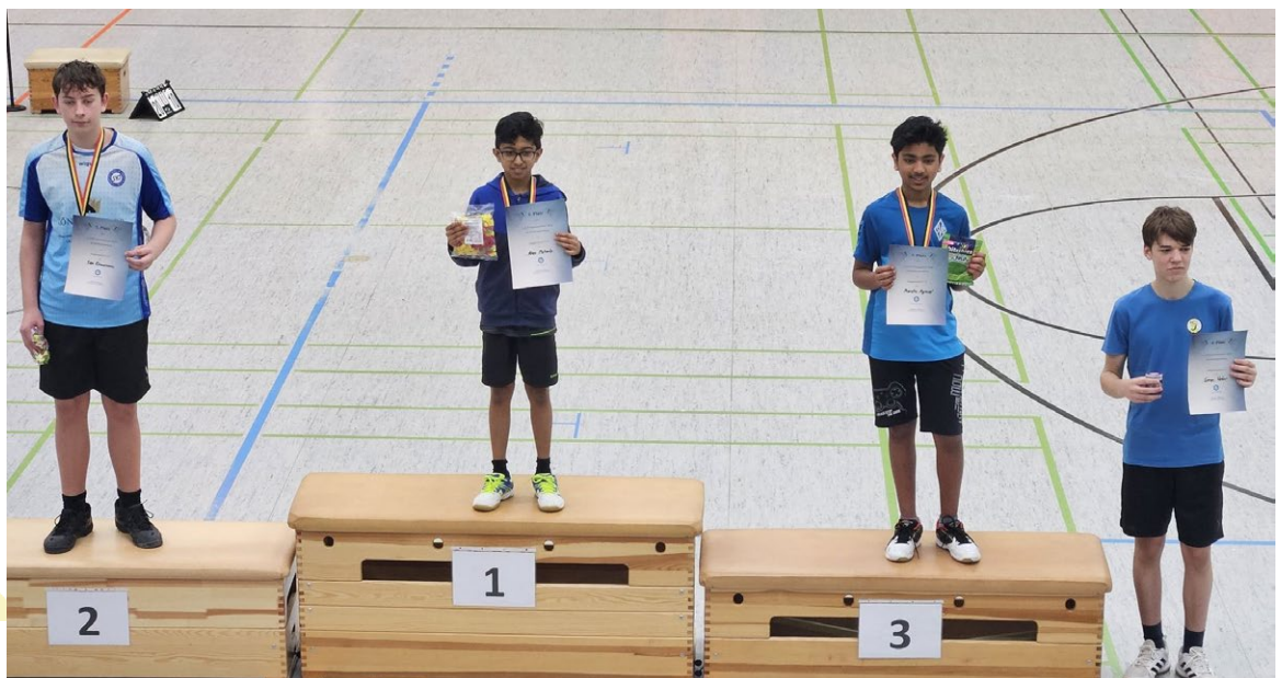
Siegerehrung Jungeneinzel U15