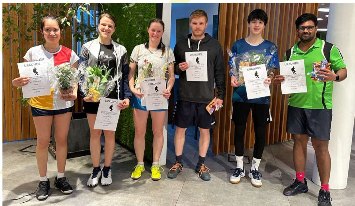
Die Sieger im Einzel