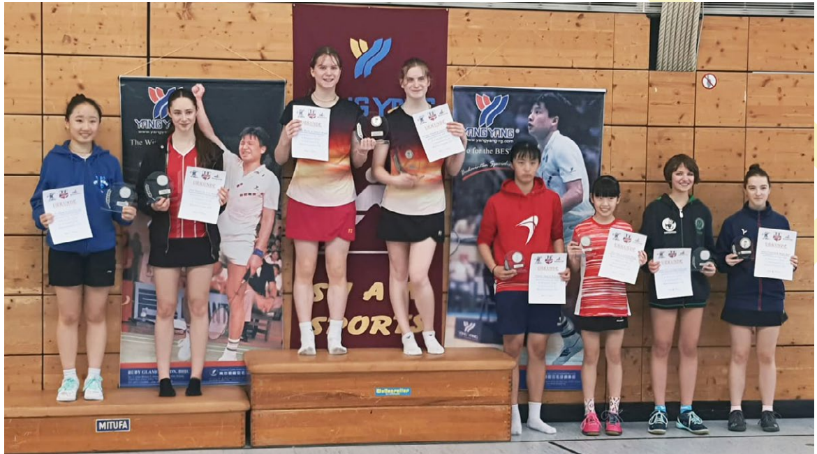
Siegerehrung Doppel mit

Das Wochenende vom 16./17. März, verbrachten 13 unserer Nachwuchsathleten in Trostberg, um die dortige A-Rangliste der Altersklasse U15 zu bestreiten. Unsere Truppe unterstützte sich gegenseitig, bei ihrem gemeinsamen Ziel, ihr Bestes zu geben und Spiele zu gewinnen. Mit von der Partie war unser Stützpunkttrainer Dominic Geiger.