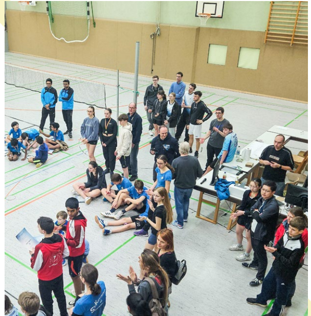
In Erwartung der Siegerehrung

Als Ausrichter bedanken wir uns bei den vielen fleißigen Helfern, der erfahrenen Turnierleitung sowie den Trainern und Spielern für die angenehme Turnieratmosphäre.