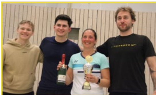
Teilnehmer der TSG Heilbronn

Die diesjährige Mannschaftswertung für die erfolgreichste Mannschaft am Turnier ging an die Spieler der TSG Heilbronn.