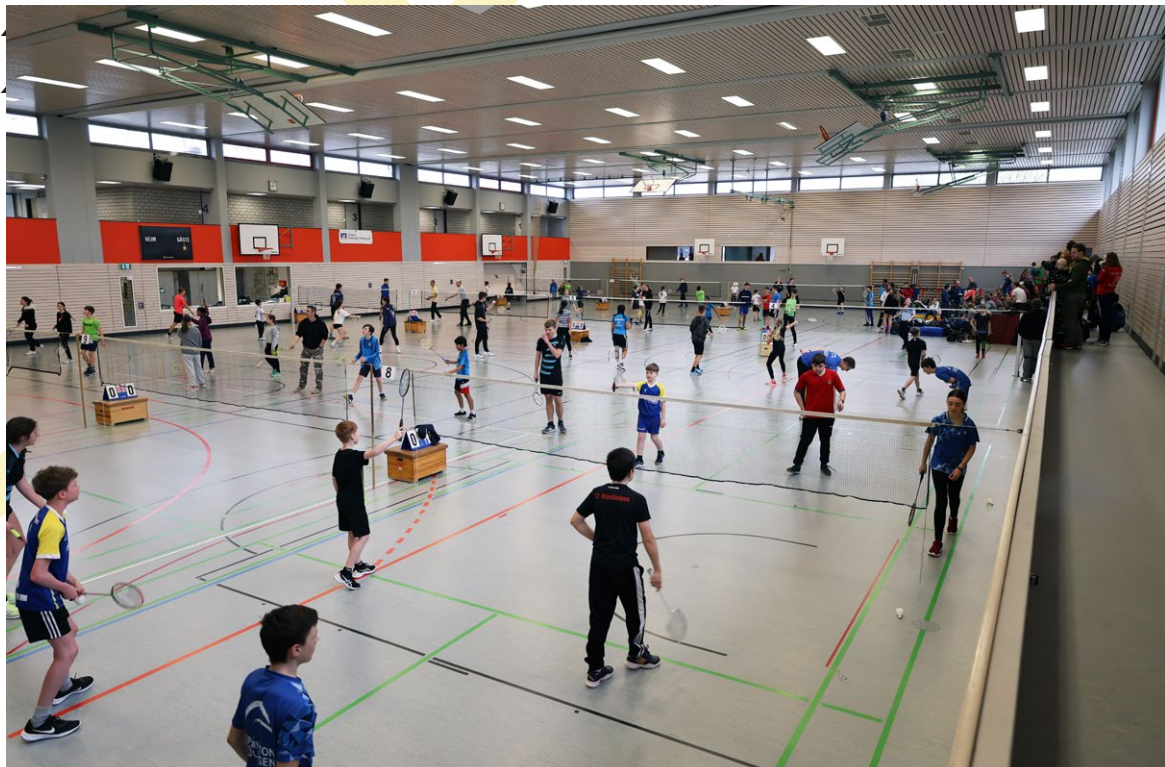
Sensationell gut war die Beteiligung bei der E-Rangliste in Riedlingen | Foto: Manuela Helfert