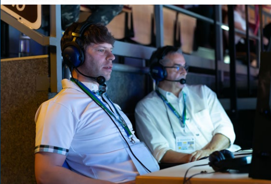
badminton_ec24 Gefolgt Nachricht senden