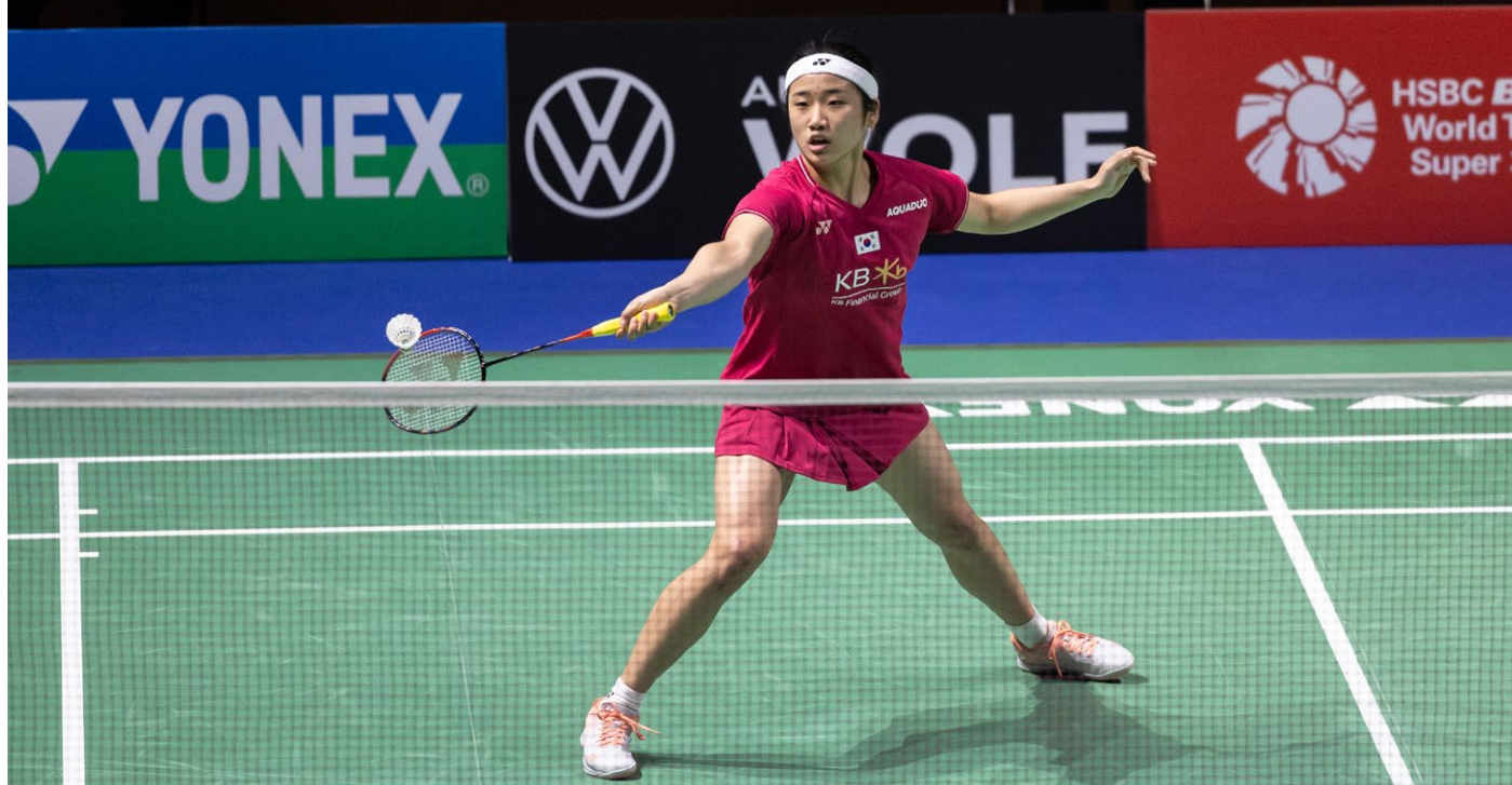
An Se Young aus Korea, Siegerin der YONEX German Open 2023, ist bei der WM in Kopenhagen die Topfavoritin