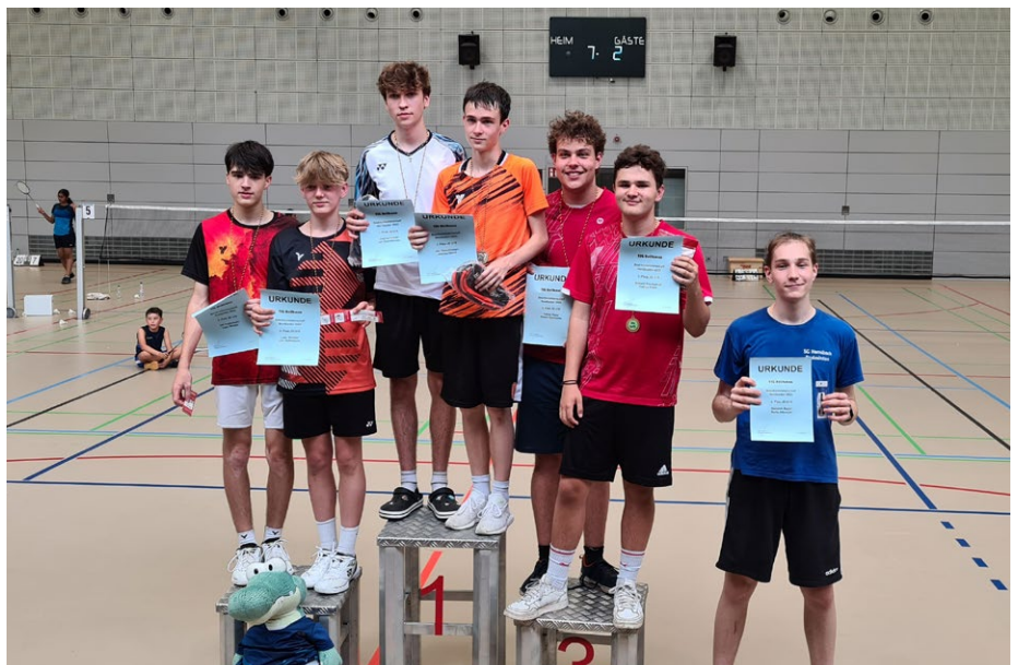
Siegerehrung Jungendoppel U19