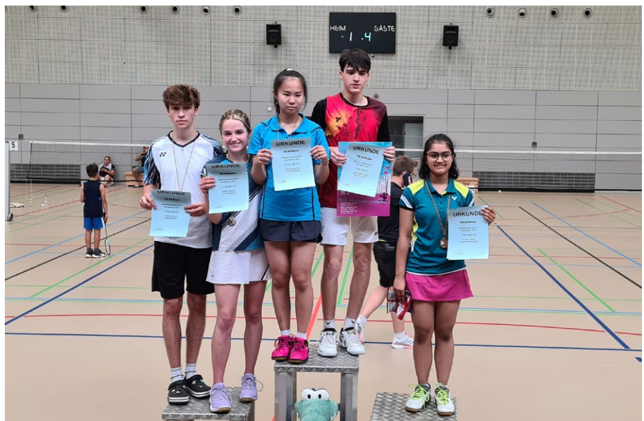
Das Podium im Mixed U19 | Foto: Tobias Herrmann