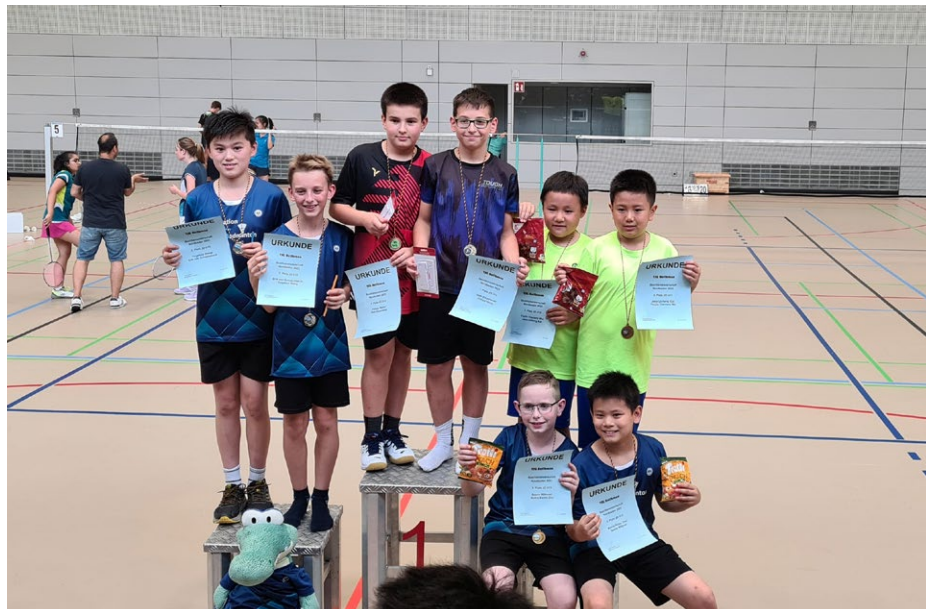
Siegerehrung Jungendoppel U13 in Heilbronn